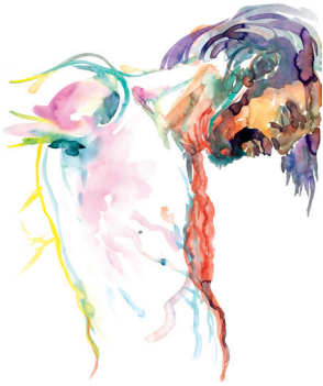
Geseling, aquarel, 2004