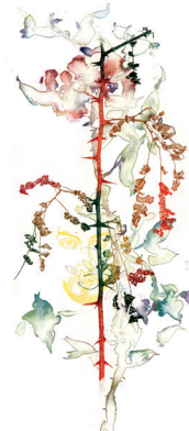
Verschiijning, ets/aquareldruk, 2005