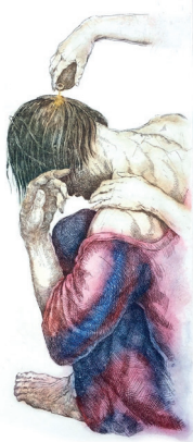
De Zalving, kleurenets