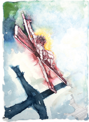
Kruisiging, pentekening/aquarel, 2022