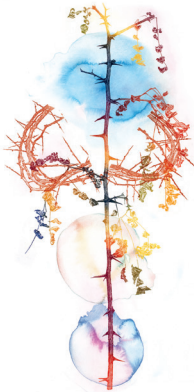
Verrijzenis, ets/aquareldruk, 2005