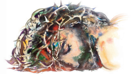
Jezus, aquarel, 2007